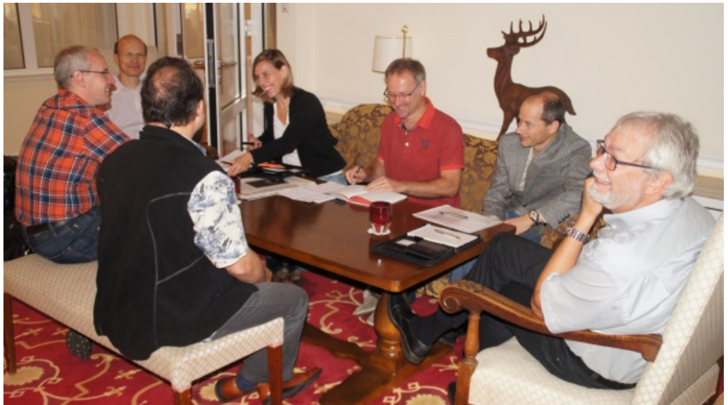
Abschließendes Planungsgespräch der beiden Regio-Teams

Zum Vergrößern der Bilder einfach das jeweilige Bild anklicken. Es wird hierbei kein neues Fenster geöffnet; Fenster danach also nicht schließen, sondern die Zurück-Schaltfläche des Browsers verwenden.